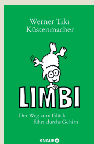
Werner Tiki Küstenmacher Limbi – Der Weg zum Glück führt durchs Gehirn 2016